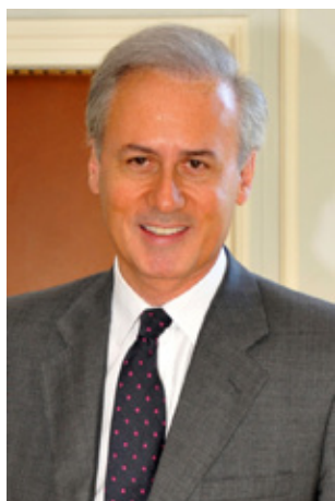
Georges Tron Ancien Ministre Maire de Draveil

S'agissant de l'accès à l'école, le projet de liaison interne au quartier s'est heurté au refus du propriétaire d'un des terrains se situant sur le trajet, d'en rétrocéder une parcelle à la ville. Depuis, il semblerait que la position de ce propriétaire ait évoluée. Si cela est avéré, la ville prendra évidemment les mesures pour que ce projet aboutisse dans les meilleurs délais.