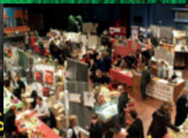
Salon des vins | p 15