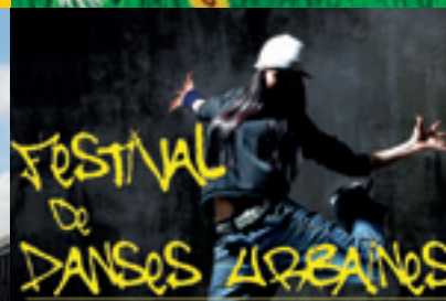
Urban New Dance | p 10