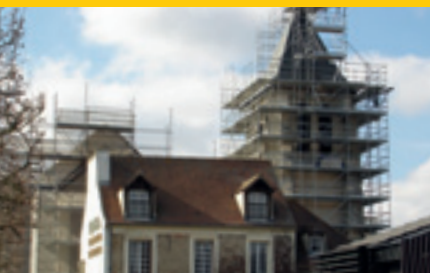
Église Saint-Rémy | p 6