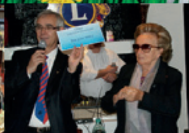
Opération Pièces jaunes | p 20