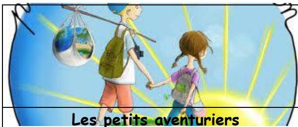
Les petits aventuriers